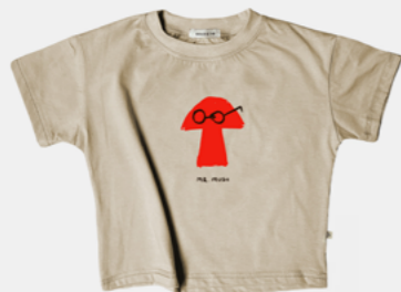
MR. MUSH SAND