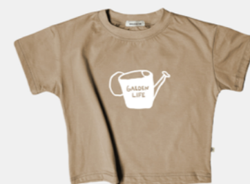
GARDEN LIFE AVELÃ