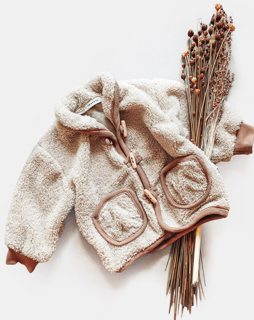
CASACO BEAR VANILLA