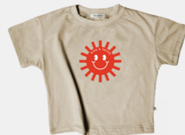
RISE AND SHINE SAND