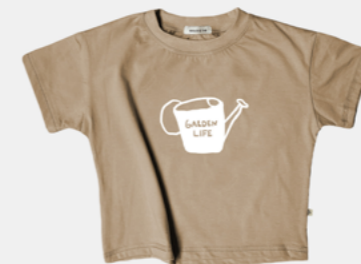
GARDEN LIFE AVELÃ