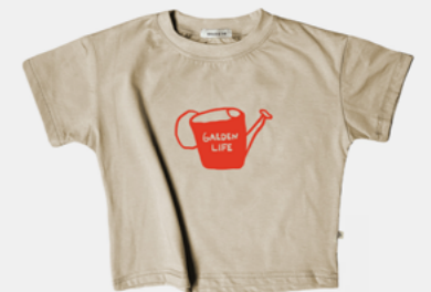
GARDEN LIFE SAND