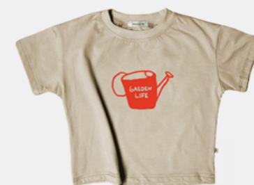
GARDEN LIFE SAND