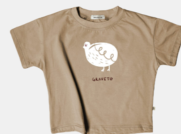
MISS POPÓ AVELÃ