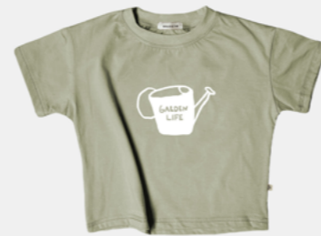
GARDEN LIFE SAGE