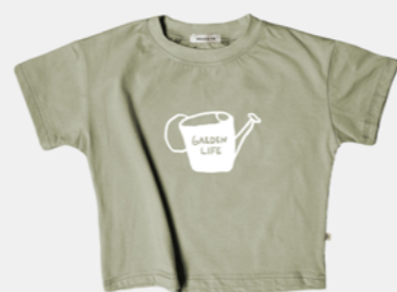
GARDEN LIFE SAGE