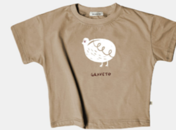
MISS POPÓ AVELÃ