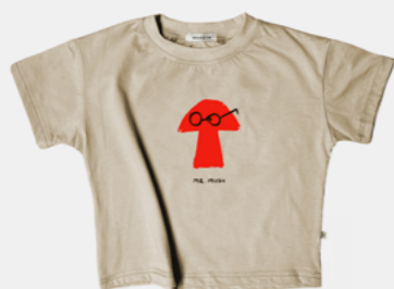
MR. MUSH SAND